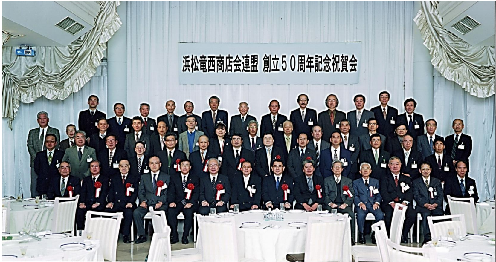
平成18年11月17日 於 吳竹荘