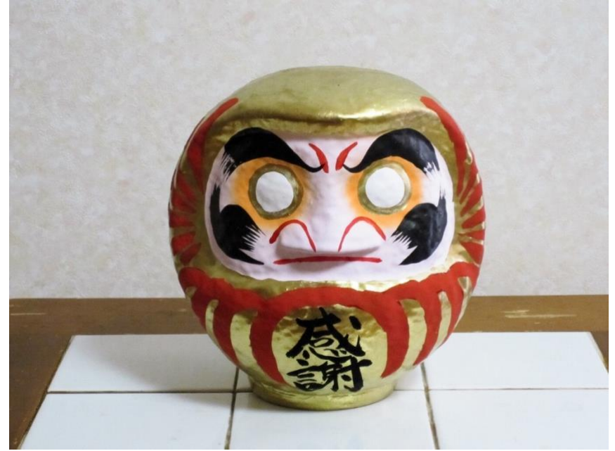
改修大変きれいに直りました。