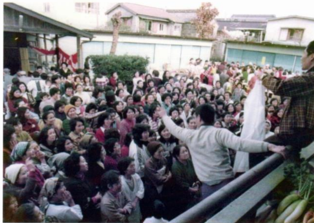
チャリティ「せり市」