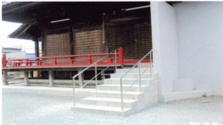
本堂西側階段を新設する。本堂周囲の床犬走りも修復した。