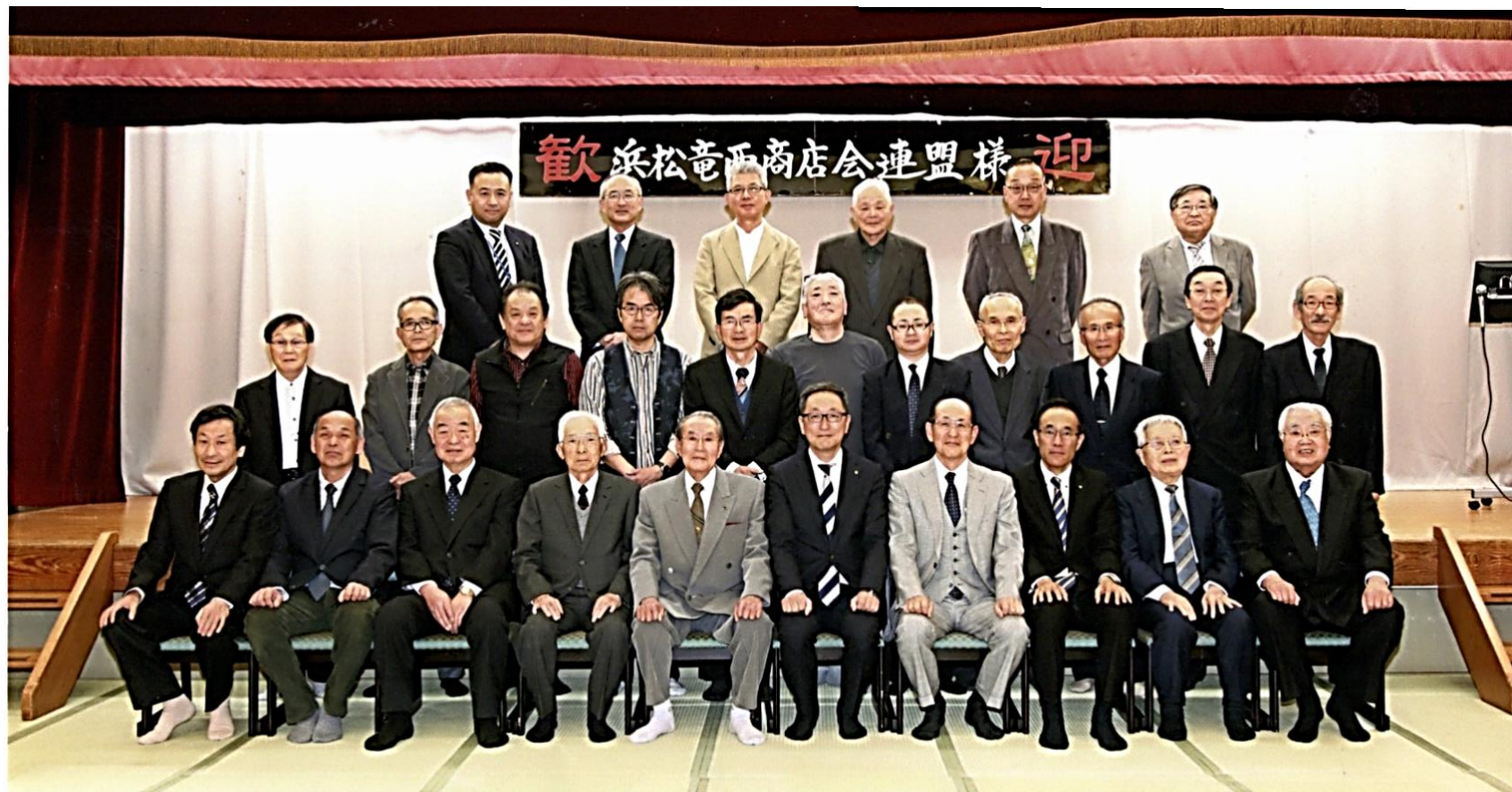
浜松竜西商店会連盟60年解散式典2018年4月13日