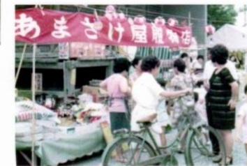
あまざけ屋履物店