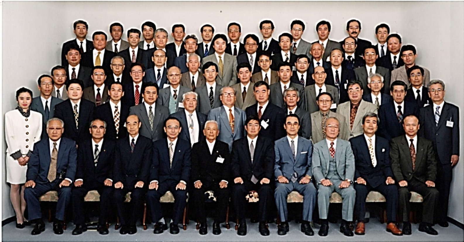
浜松竜西商店会連盟創立40周年記念 96・10・22 於JOYアネックス呉竹荘