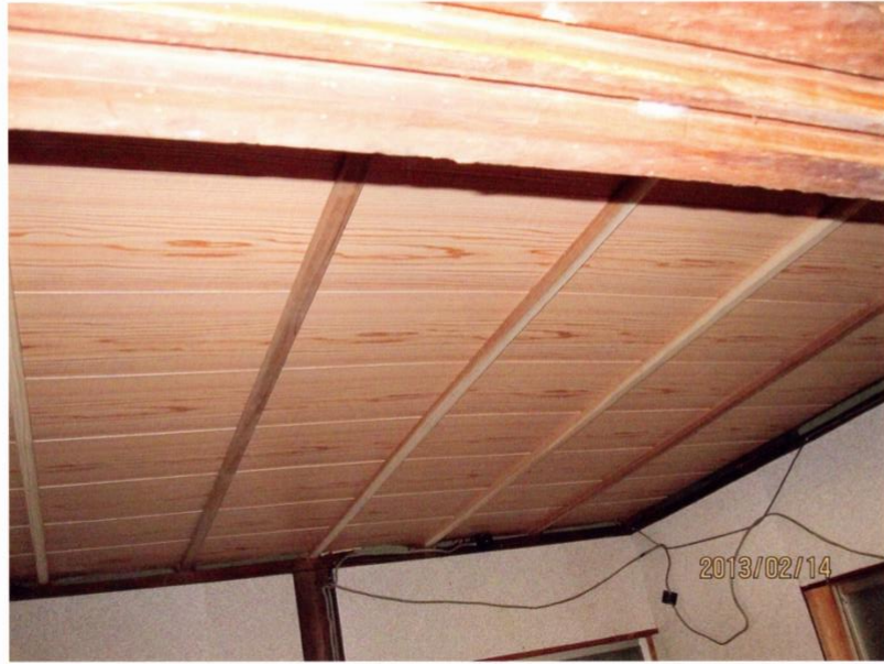
だるま会館の内部